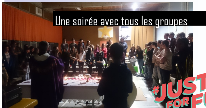
Une soirée avec tous les groupes