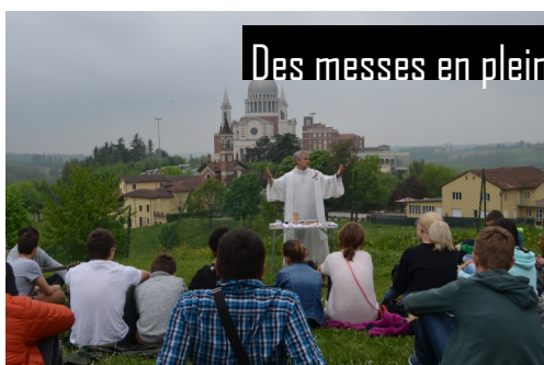
Des messes en plein air

DES MENUS TOP CHEF UNE ACTION DE NOEL UNE EQUIPE D'ANIMATION DES INVITES DE CHOC LA MESSE ENSEMBLE UN MEETING CANTONAL UN PELERINAGE FINAL UNE CURE OUVERTE UN MIX DE FUN ET DE FOI