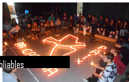
Des veillées inoubliables

« Vous êtes à un âge d'incroyables changements, où tout semble possible et impossible en même temps. Je vous répète avec beaucoup de force : « Demeurez sur le chemin de la foi avec une ferme espérance dans le Seigneur. Là se trouve le secret de notre chemin ! Lui nous donne le courage d'aller à contrecourant. Croyez-moi : cela fait du bien au cœur, mais il faut du courage pour aller à contrecourant et lui nous donne ce courage ! Avec lui nous pouvons faire de grandes choses ; il nous fera sentir la joie d'être ses disciples, ses témoins. Mettez sur les grands idéaux, sur les grandes choses. Nous chrétiens nous ne sommes pas choisis par le Seigneur pour de petites bricoles, allez toujours au-delà, vers les grandes choses.