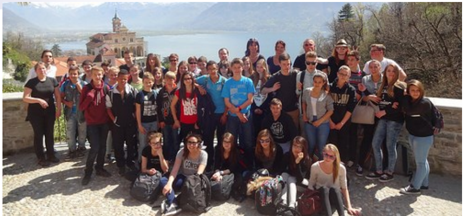
Madonna del Sasso, Pélé Ardon-Vétroz, avril 2014