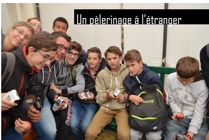
Un pèlerinage à l'étranger