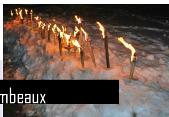
Une marche aux flambeaux