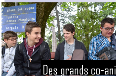
Des grands co-animateurs

DES MENUS TOP CHEF UNE ACTION DE NOEL UNE EQUIPE D'ANIMATION DES INVITES DE CHOC LA MESSE ENSEMBLE UN MEETING CANTONAL UN PELERINAGE FINAL UNE CURE OUVERTE UN MIX DE FUN ET DE FOI